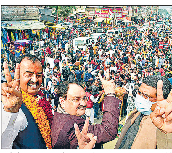
डिप्टी सीएम केशव प्रसाद मौर्य के नामांकन में गुरुवार को पहुंचे भाजपा अध्यक्ष जेपी नड्डा, यूपी चुनाव प्रभारी धर्मप्र प्रधान।

कौशांबी संवाददाता उपमुख्यमंत्री केशव प्रसाद मौर्य ने गुरुवार को कौशांबी की सिराथू विधानसभा सीट से नामांकन दाखिल किया। उनके नामांकन के दौरान भाजपा के राष्ट्रीय अध्यक्ष जेपी नड्डा, यूपी चुनाव प्रभारी और केन्द्रीय मंत्री धर्मप्र प्रधान मौजूद थे। इस मौके पर केशव प्रसाद मौर्य ने कहा कि 2022 में सरकार बनी तो यूपी में इतनी गोशालाएं बनवा देंगे कि कभी छुट्टा पशु खेतों में चरने के लिए नहीं दिखेगा। तंज किया कि सपा वाले भी कुछ पशु छोड़ दे रहे हैं। भाजपा-अपना दल-निषाद पार्टी की त्रिवेणी है, हमारे यहां अण्डा-पिछड़ा-दलित की भी त्रिवेणी है।